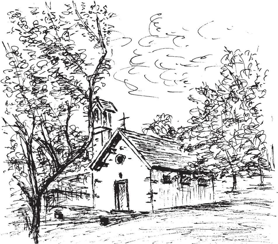
chapelle de Stampourmont

Tél 03 88 35 30 76 www.club-vosgien-strasbourg.net