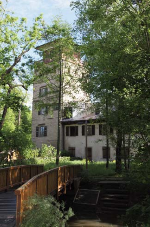
Accès à la tour par la passerelle

Depuis 2012, le CVS a été sollicité par la ville de Strasbourg pour un projet de création d'un Parc Naturel Urbain (PNU). Il y a eu un certain nombre de réunions auxquelles nous avons participé et présenté le principe du balisage en ville. En effet, fort de notre expérience du balisage des trois sentiers urbains de Strasbourg - la Ceinture Verte, le sentier de l'III et le Sentier Stanislas-Kléber, nous étions bien placés pour conseiller la ville et proposer de réaliser le balisage.