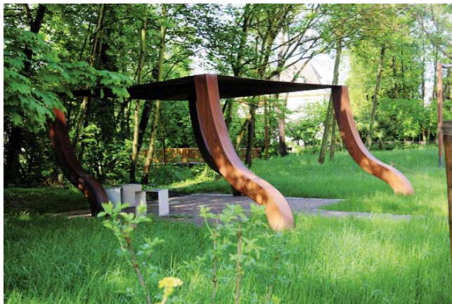
L'abri de rouille

Ce fut un week-end ensoleillé. Le samedi, nous avons projeté un diaporama sur la Ceinture Verte et le PNU en collaboration avec l'association ZONA ( https://www.facebook.com/CeintureVerteDeStrasbourg/info?tab=page_info )