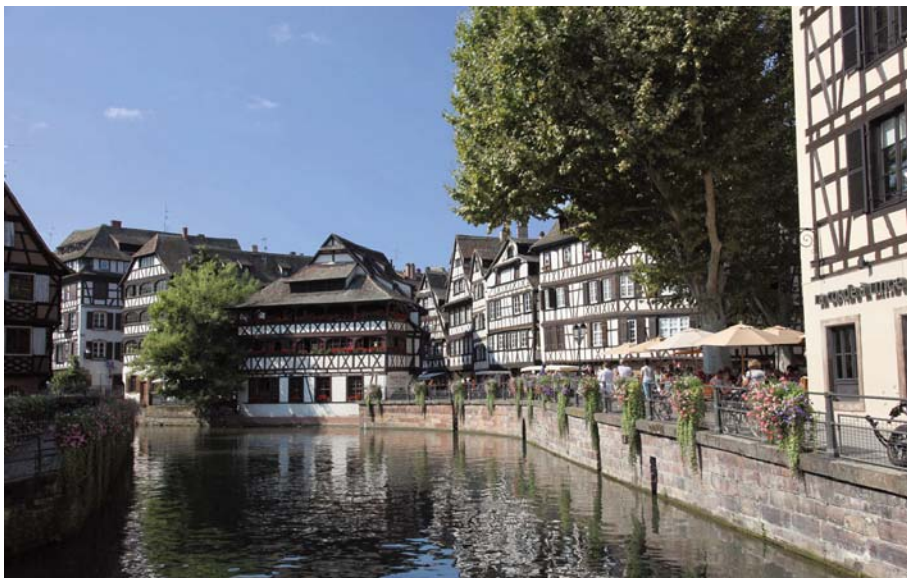
La Petite France

Cette année, le temps fut clément pour cette nouvelle édition du rallye « A la découverte de la Petite France » et de ses histoires, derrière des façades multicolores gainées de colombages. Les moulins n'écrasent plus, ni les grains, ni les denrées coloniales, mais les remous de l'eau font encore vibrer l'âme du quartier.